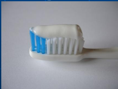
Dentifrícios e enxaguatórios