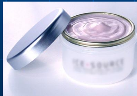
Creμες e sabonetes