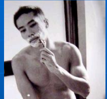
Produtos para barba